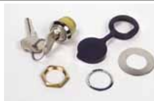
Ontgrendelingslot met gepersonaliseerde sleutel van nr. 1 tot 50

Artikelcode 424550001 tot 424550050 Prijs (€)