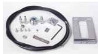
Kabelset voor externe ontgrendeling op handgreep

• (*) Voor garagedeuren van 3 tot 5m. breedte (hoogte 2,7m.) dient U gebruik te maken van 2 motoren (550 en 550 Slave). De ingebouwde sturing van de 550 beheert de beide motoren.