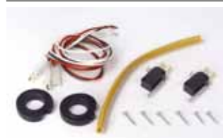
Kit eindschakelaars open en dicht (ingebouwd bij aandrijving 550 ITT) Artikelcode 390567 Prijs (€)