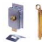
Diverse toebehoren pagina 179