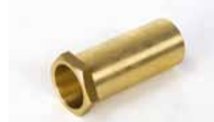
Verlenging externe ontgrendeling voor garagedeuren groter dan 15 mm. dikte